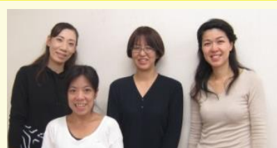
桜井市サークルYのみなさん

みみなし診療所では、胃カメラ検査は鎮静剤で眠っている間に終わりました。実際ホントに楽でした。大腸カメラも本当に楽に受けられました。主人にも勧め、大きなポリプが見つかり、大病院を紹介してもらいましたがものすごく痛かったようで、これからは大きくなって処置してもらいたいと言っています。医師も看護師も家庭的な雰囲気です。最近、ご近所の方にも勧め、何人かが、みみなし診療所で受けられました。遠いので、往復送迎してもらえのうれしく、その分、みんなを増やしています。遠くから行くので、診察までの待ち時間にサロンでコーヒーが飲めるのもいいですね。