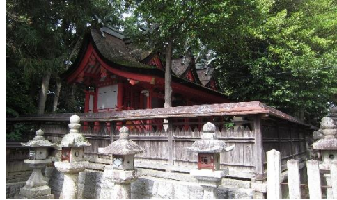
① 鏡作師の氏神さま。境内の鏡池で身を清め、鏡作りに励んだといわれています。

コース 近鉄田原本駅 ⇒ ①鏡作神社 ⇒ ②首切地蔵尊 ⇒ ③道の駅レスティ唐古・鍵 ⇒ ④唐古・鍵遺跡史跡公園 ⇒ ⑤遺構展示情報館 ⇒ ⑥復元楼閣