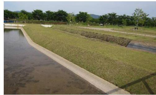
④ 弥生時代の大規模な環濠集落遺跡。復元された環濠や楼閣を美しい自然の中に見ることができます。