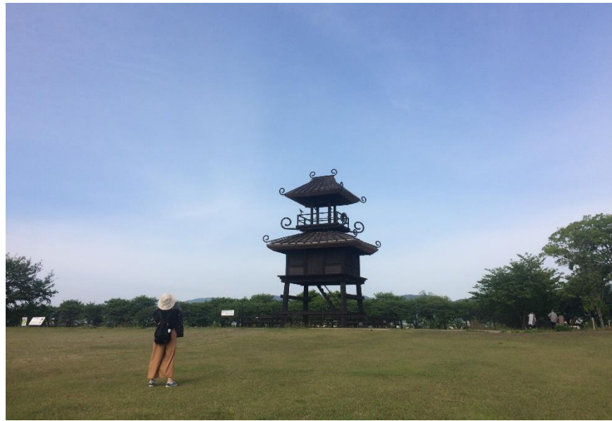
⑥ 桜の季節は絶好のお花見スポット。私たちが歩いた日は新緑がきれいでした。