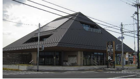
③ 休憩にぴったり。奈良のおいしいもの、お土産がたくさんあります。