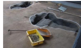
⑤ 発掘調査の状況を再現しています。