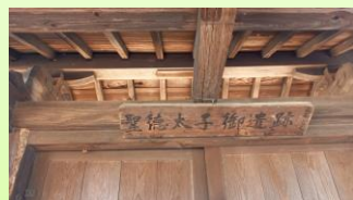
「聖徳太子御遺跡」の看板