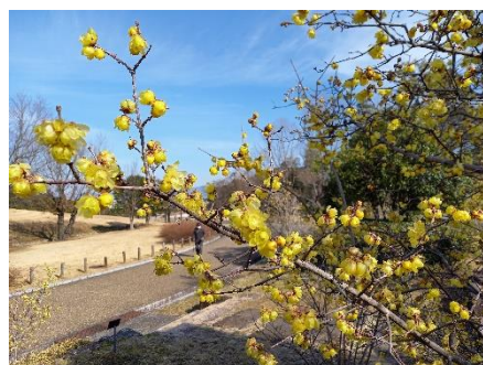
春待ちの丘に咲く「蠟梅」

お弁当を持って行ってお気に入りの場所で食べることもできます。また公園内にあるカフェで食事もできます。