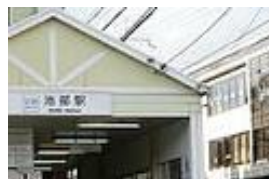
近鉄田原本線池部駅