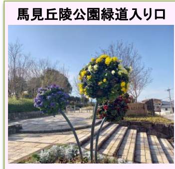
馬見丘陵公園緑道入り口

緑道エリアを通過して北エリア(1 km)から中央エリアへ梅花をめぐってウォーキング