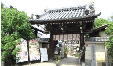
春日神社の向かい側、JR 畝傍駅から「長寿道」をたどっておふさ観音へ。夏は風鈴、春と秋にはバラが迎えてくれる。めずらしいメダカが飼育されているのでメダカ好きにはうれしい!

交差するところが札ノ辻と呼ばれ、東の平田家の南西が高札場（掲示板）のあった場所。