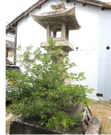
江戸時代伊勢神宮に参拝する「おかげ参り」の人々に湯茶や食事を接待したセンタイバ跡。