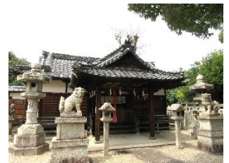
春日神社。巨木がありすぐ横が道路だということ忘れそうな静かさ。