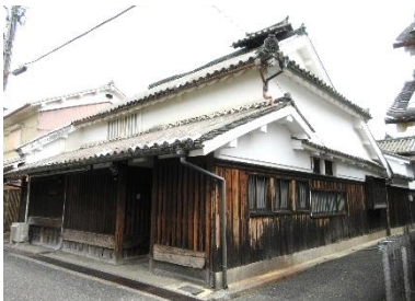
幕末の儒学者谷三山の生家。吉田松陰も訪れたことがある。（非公開）