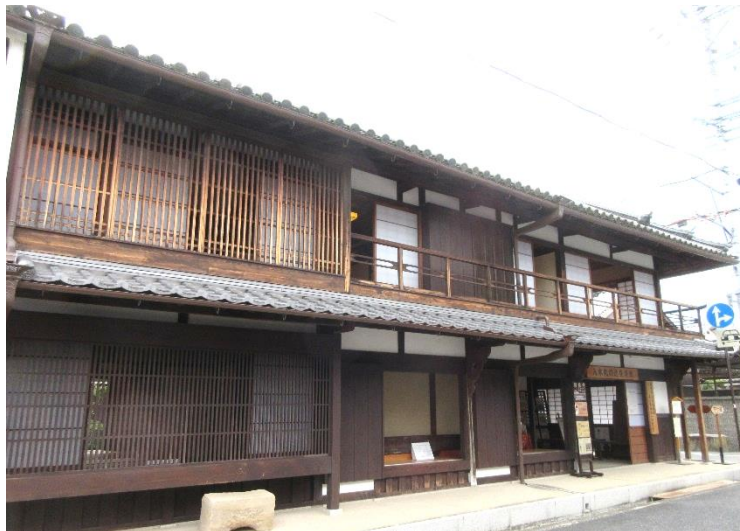
東の平田家（旧旅籠）を改修して「八木札ノ辻交流館」として公開。2階の窓からは高札場にあった井戸も見える。

奈良盆地を南北に縦走する下ツ道は、見瀬丸山古墳から橿原市、田原本町、天理市、平城宮の朱雀門へと続く道。横大路は東西をつなぐ道で、桜井市から葛城市竹内街道、難波宮へと続く日本最古の官道といわれている。