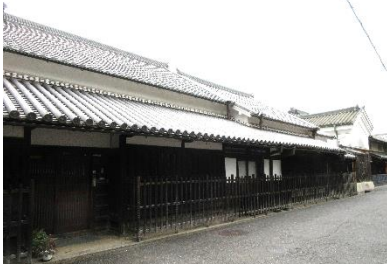
天保13年（1842年）には「絞り油屋」を営んでいた河合家の住宅。（非公開）

「下ツ道」と「横大路」は、日本書紀壬申の乱（672年）の記述にもある古代の官道です。二つの道が交差するところが「札ノ辻」。みみなし診療所からほど近い八木町を通る「下ツ道」をおふさ観音まで歩く約7kmのコースです。見学などの時間を入れても所要時間は2時間程です。 近鉄大和八木駅 ⇒ かしはらナビプラザ（地図・パンフレットがもらえます）⇒ 芭蕉句碑 ⇒ 八木札ノ辻交流館 ⇒ 接待場跡 ⇒ 延命院八木寺・春日神社 ⇒ JR 畝傍駅 ⇒ 長寿の道 ⇒ おふさ観音 ⇒ 近鉄大和八木駅 ☁️ 平坦なコースですが、道路は狭く車も通り、踏切もありますので安全には気をつけてください。