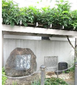
松尾芭蕉が貞享5年（1688年）「笈の小文」の旅で八木町付近に泊まった時の俳句。「草臥れて宿かる比や藤の花」句碑の上には藤棚がある。