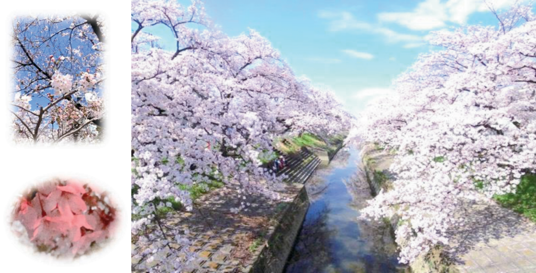
高田川を挟んで南北約2.5kmの桜並木が続きます。

高田千本桜は、1948年（昭和23年）市政施行を記念して植樹されました。毎年、3月下旬から4月上旬にかけて高田川を桜が彩ります。