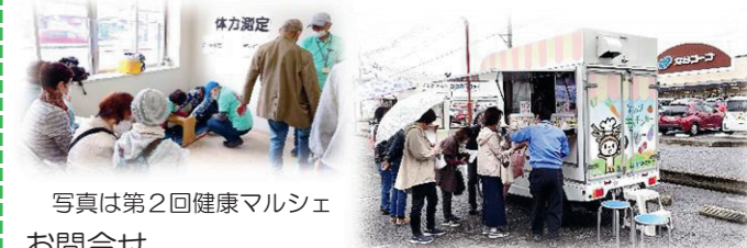
写真は第2回健康マルシェ

日時：2026年4月26日(日) 11:00～14:00 (小雨決行) 会場：奈良県医療福祉生活協同組合 みみなし診療所 生協ホール・西側駐車場(橿原市木原町230-1)